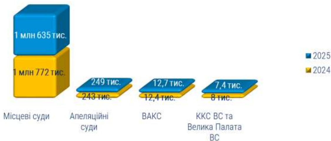
Розгляд справ і матеріалів кримінального судочинства та про адміністративні правопорушення у 2024-2025 роках

Протягом 2025 р. на 10 % зменшилася кількість осіб, стосовно яких в апеляційному порядку скасовано і змінено вироки місцевих загальних судів, – 5,4 тис. [6 тис.]; їх частка від кількості осіб, щодо яких ухвалено вироки місцевими загальними судами, становила 8 % [8 %]. Усього в апеляційному порядку скасовано та змінено вироки та ухвали місцевих загальних судів щодо 12 тис. [12,4 тис.] осіб (менше на 3 %).