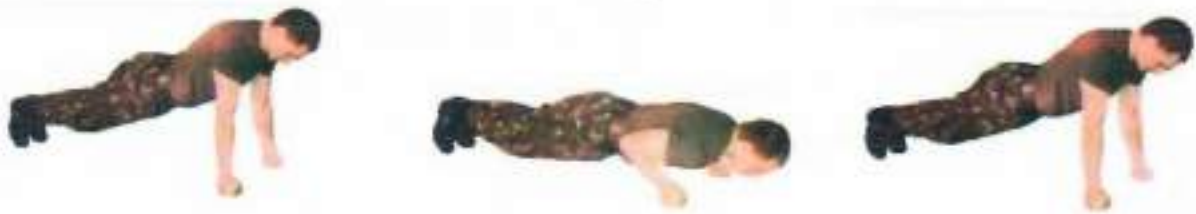
Фото 3. Згинання та розгинання рук в упорі лежачи