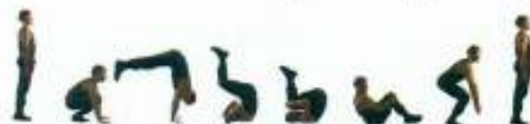
Фото 37. Обертання вперед.

В.П. – стройова стійка. Виконати присідання з упором, нахилити голову до грудей, відштовхнутися ногами й перенести вагу всього тіла на руки. Виконати обертання вперед згрупувавшись. Встати у В.П. (фото 37).