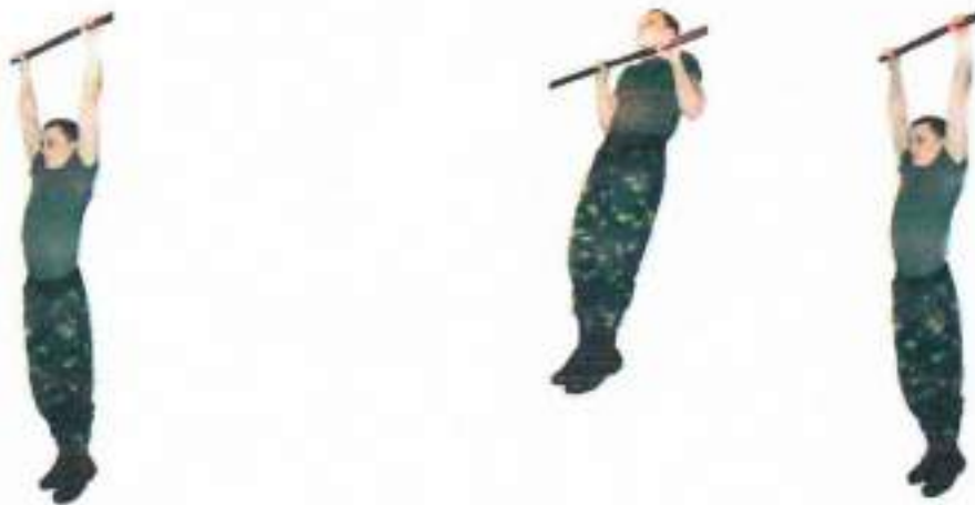
Фото 1. Підтягування на перекладині

Час на виконання вправи необмежений, результат виконання – кількість разів підтягування (фото 1).