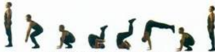
Фото 38. Обертання назад

В.П. – стройова стійка. Виконати присідання з упором, нахилити голову до грудей, виконати обертання назад, прийняти положення упору присівши. Встати у В.П. (фото 38).