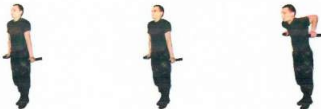
Фото 2. Згинання та розгинання рук на поперечних жердинах

Виконується з упору на брусах. За командою «СТАРТ!» виконавець вправи починає ритмічно з повною амплітудою згинати та розгинати руки. Вправа вважається виконаною, якщо повністю зігнуті та розігнуті руки. Забороняється виконувати махи, бути у вихідному положенні із зігнутими руками понад 1 секунду, розгинати руки по черзі, розгинати і згинати руки не з повною амплітудою. Час на виконання вправи необмежений, результат виконання – кількість разів виконаної вправи (фото 2).