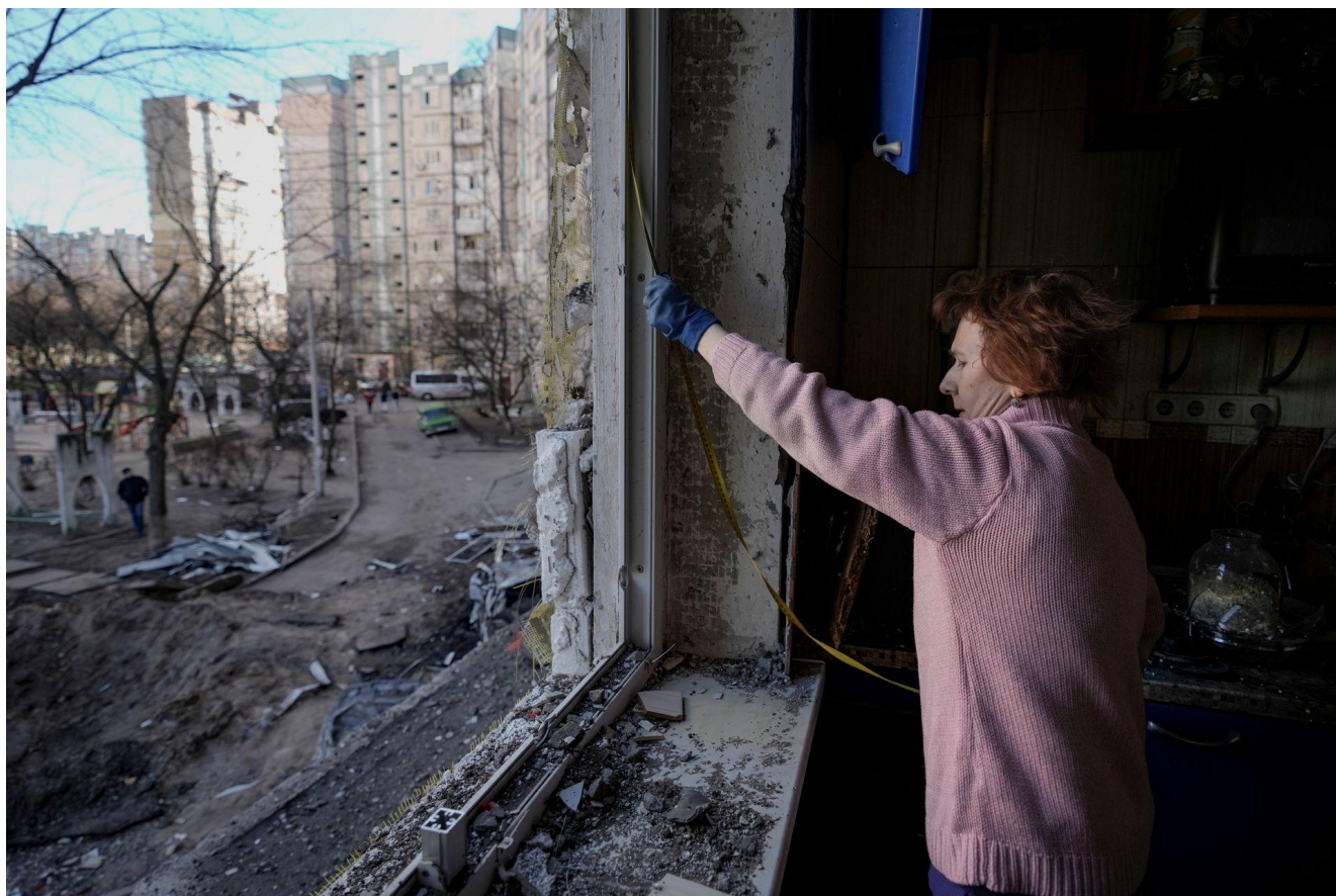
Жінка міряє вибите вікно у пошкодженій бомбардуванням будівлі, Київ, 21 березня 2022 року. (прим. - ЮрФем)

Аналіз проблеми. Загальний огляд. Російська агресія супроводжується завданням надзвичайно великої шкоди як населенню, так і цивільним об'єктам та інфраструктурі. У вересні 2022 року уряд України спільно зі Світовим Банком оцінював лише прямі майнові збитки в розмірі 326 млрд дол. США 99 . Ця сума ще підлягатиме уточненню, однак остаточна оцінка розміру майнової і немайнової шкоди точно буде вищою за сотні мільярдів доларів США.