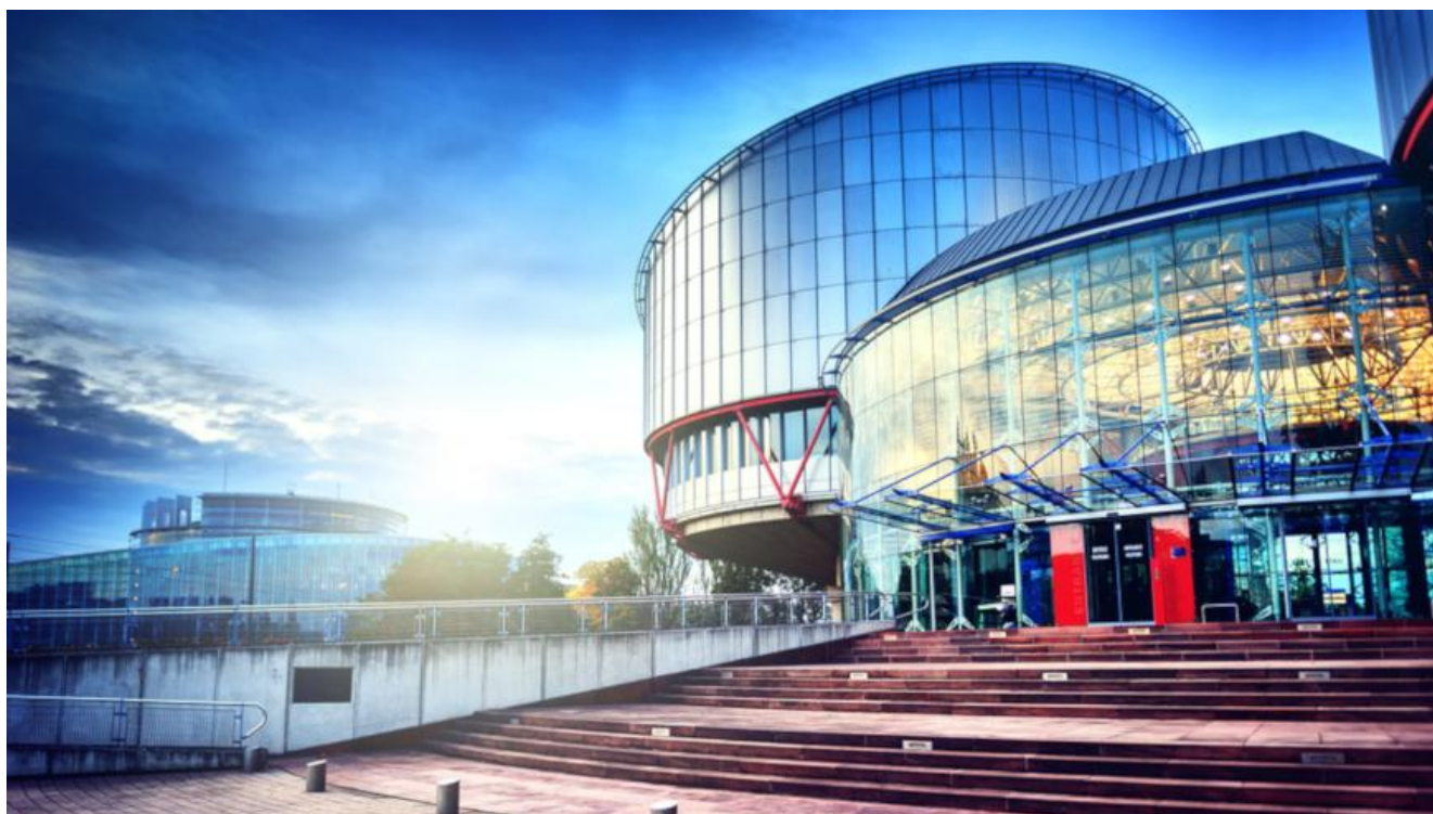
Будівля Європейського суду з прав людини, Страсбург, Франція. (прим. - ЮрФем)

широкомасштабного нападу на цивільне населення, такі діяння будуть також кваліфіковані як злочини проти людяності відповідно до статті 7 РС. Юрисдикція МКС в українському контексті також поширюється на злочин геноциду, який може вчинятися, зокрема, шляхом сексуального насильства.