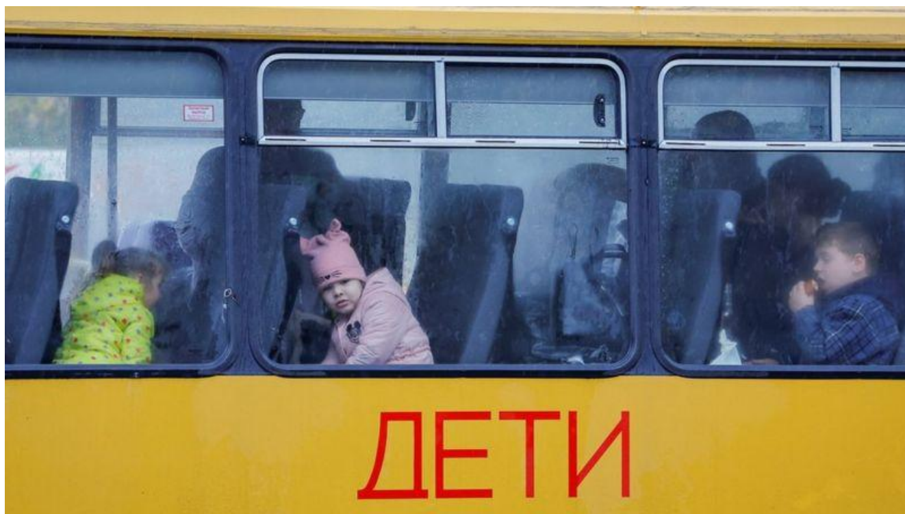
Автобус з дітьми, що прямував з окупованого Херсона (південь України). Жовтень 2022 року. (прим. - ЮрФем)

Висновки. Міжнародне гуманітарне та кримінальне право містить низку норм, що забороняють примусове переміщення цивільного населення, зокрема дітей. Метою їх закріплення стала необхідність захистити цивільне населення від спроб окупаційної держави змінити демографічну структуру населення певного регіону. Тому примусове вивезення російською федерацією українських дітей, особливо дітей-сиріт, дітей, позбавлених батьківського піклування, та дітей, чиї батьки загинули під час бойових дій, є грубим порушенням прав і свобод цих дітей.