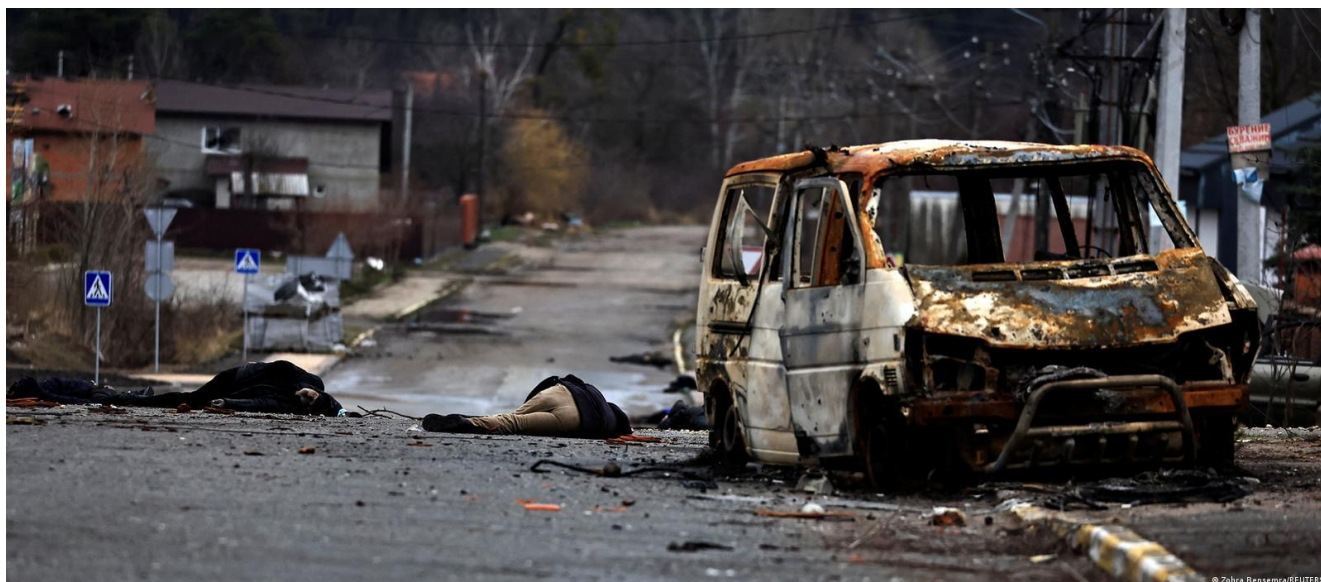
Буча (Київська область). Одна з головних вулиць міста, яка всяєна трупами і спалених танків росіян” (прим. - ЮрФем)

5) порушення прав людини з боку РФ – шаблонні. У випадку встановлення контекстуального елемента ( широкомасштабного та систематичного нападу на цивільне населення ) вони мають бути кваліфіковані як злочини проти людяності та навіть злочин геноциду, а саме: вбивства, зґвалтування, викрадення, депортації цивільних осіб. Як приклад – масові воєнні злочини в м. Буча, Ірпінь, Гостомель та інших містах на півночі