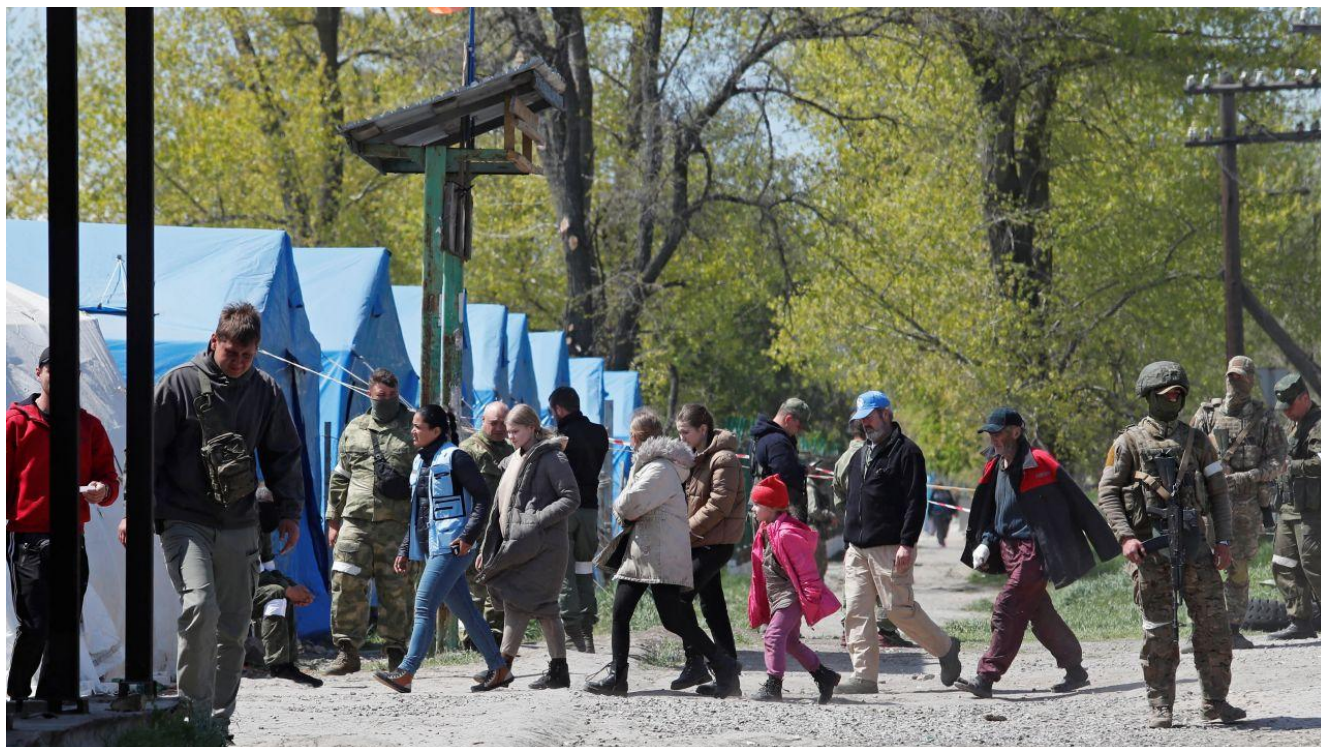
Евакуйовані з Маріуполя (Донецька область) мирні жителі прибувають у російський фільтраційний табір у Безіменному (Донецька область) на сході України 1 травня 2022 року. (прим. - ЮрФем)

Згідно з частиною 1 статті 49 Женевської конвенції про захист цивільного населення під час війни забороняється, незалежно від мотивів, здійснювати примусове індивідуальне чи масове переселення або депортацію осіб, що перебувають під захистом, з окупованої території на територію окупаційної держави або на територію будь-якої іншої держави, незалежно від того, окупована вона чи ні. І хоча згідно з частиною 2 цієї статті окупаційна держава може здійснювати загальну або часткову евакуацію з певної території, таке переміщення має бути необхідним для забезпечення безпеки населення або зумовлено особливо вагомими причинами військового характеру. Проведення таких евакуацій не може передбачати