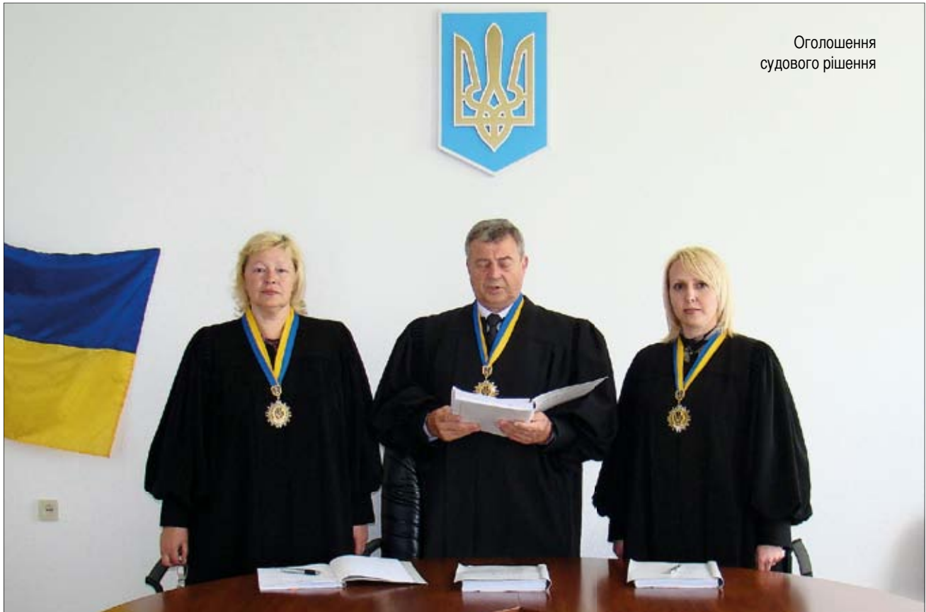
Оголошення судового рішення