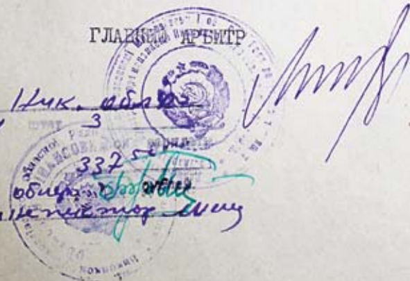
Штатний розпис держарбітражу при Миколаївському облвиконкомі на 1966 рік (ДАМО, Ф.р-5585, оп. 1, стр. 5, арк. 2)