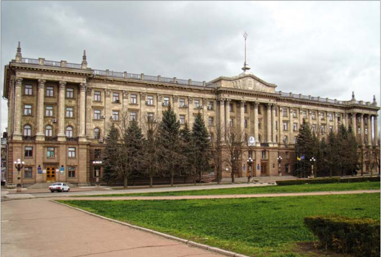
Будинок Миколаївської міської ради, в приміщенні якого в 70-80-ті роки ХХ століття розташовувався Миколаївський державний арбітраж

цій»: підприємства стали більш ретельно дотримуватися термінів поставки продукції. Більшість вищевказаних справ було розглянуто на підприємствах із запрошенням покупців. Загалом було розглянуто 98 справ з виїздом на підприємства.