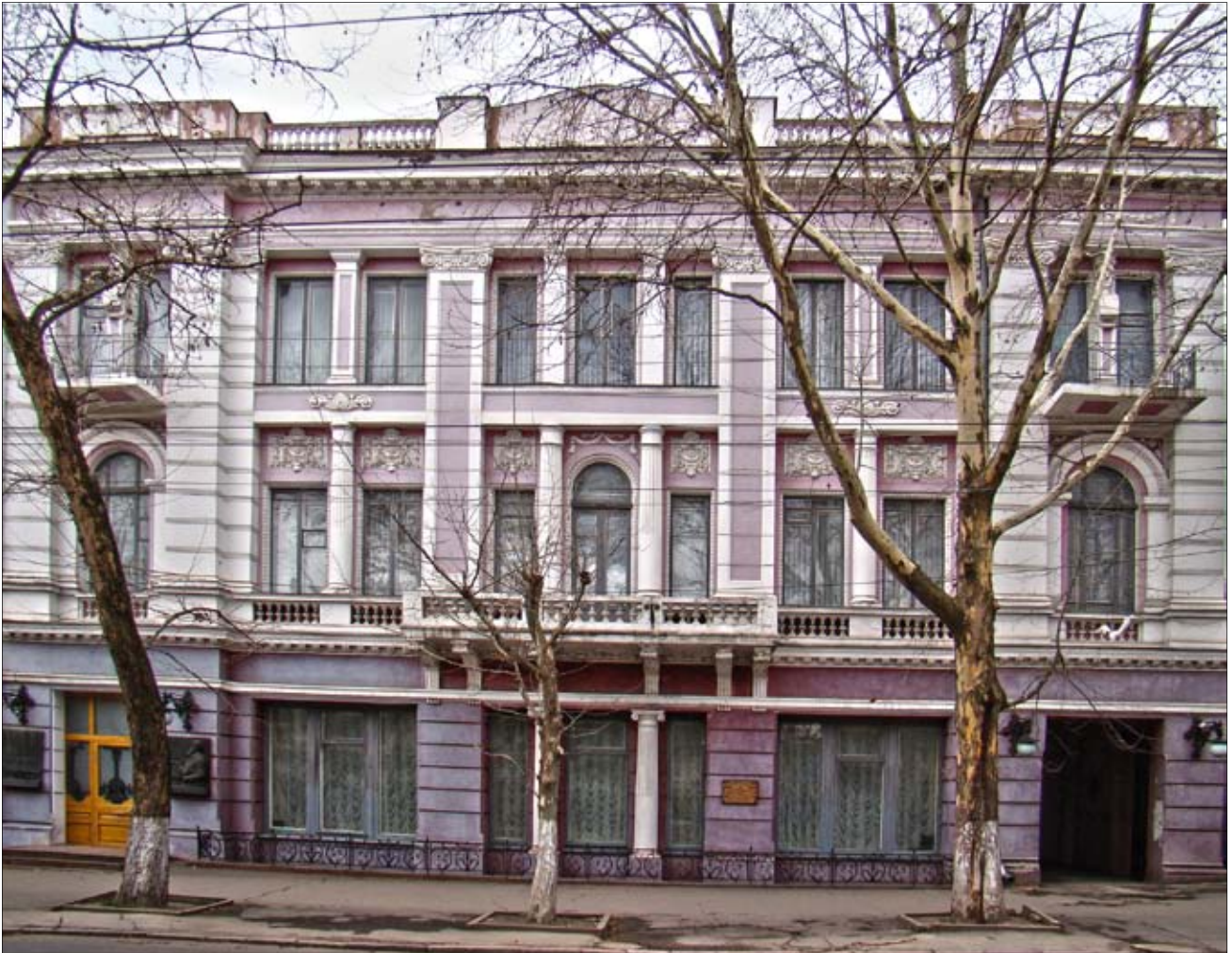
Будинок, у приміщенні якого в 60-ті роки ХХ століття розташовувався Миколаївський державний арбітраж. Сьогодні будівлю займає Миколаївський художній музей ім. В.В. Верещагіна

облспоживспілкою. 9 заяв по спорах щодо асортименту надійшли до Миколаївського лікєро-горілочного заводу: підприємства-покупці вимагали збільшення поставок горілки «Столичної» та зменшення поставок горілки «Московської». Збільшилася кількість позовів щодо стягнення неустойок за недопоставку продукції і товарів через невиконання планів підприємствами області: трикотажним об'єднанням, Вознесенським м'ясокомбінатом, Жовтневим промкомбінатом, каменедробильним заводом «Граніт», заводами металовиробів та конденсаторним. Порівняно з попереднім роком на 20% зменшилася кількість спорів щодо поставок недоброякісної продукції. На підставі матеріалів міського комі-