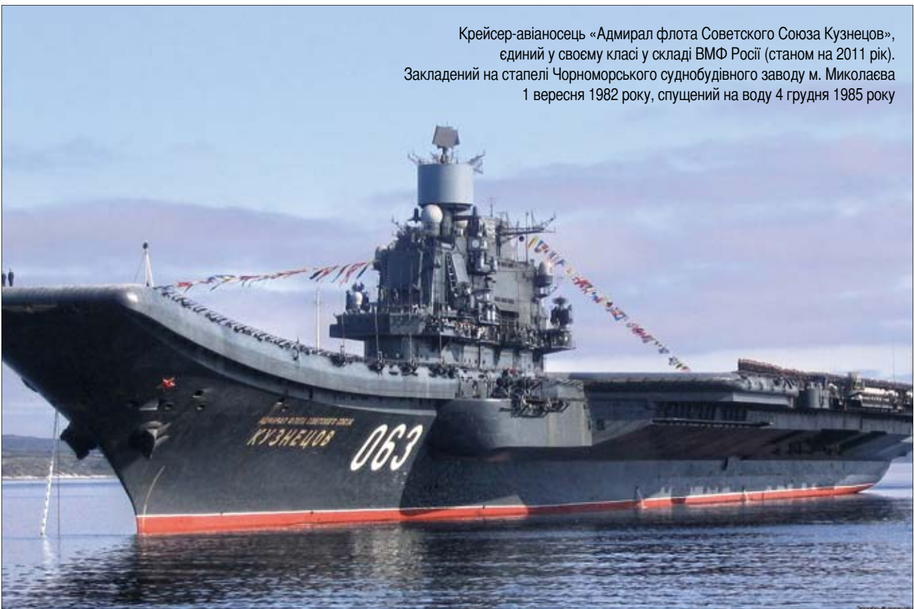
Крейсер-авіаносець «Адмірал флота Советского Союза Кузнецов», єдиний у своєму класі у складі ВМФ Росії (станом на 2011 рік). Закладений на стапелі Чорноморського суднобудівного заводу м. Николаєва 1 вересня 1982 року, спущений на воду 4 грудня 1985 року

Посилення ролі господарських договорів у повоєнний період обумовило зростання кількості питань щодо відповідності того чи іншого господарського договору інтересам держави і суспільства. Як наслідок, збільшилася кількість відповідних судових спорів. Переломним моментом у реформуванні судового порядку розгляду спорів та розвитку держарбітражу області стало проголошення незалежної України 1991 року.